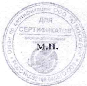
СХЕМА СЕРТИФИКАЦИИ: 1с (ГОСТ Р 53603-2009. Оценка соответствия. Схемы сертификации продукции в Российской Федерации).